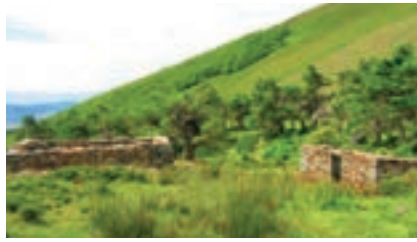
Poblado de Castromorca del siglo XVI, el más antiguo poblamiento pasiego.

Espinosa ofrece a los visitantes una amplia y variada red de senderos, tanto para las personas aficionadas a la alta montaña como para suaves excursiones familiares a través de parajes de gran belleza natural