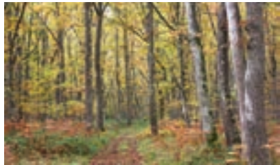
Robledal del Monte Edilla (conocido como El Campamento)