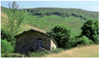
Cabaña pasiega con tejado de lastras de piedra, en el valle de La Sía.