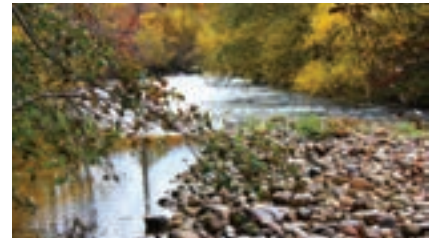
Río Trueba a su paso por el "Campamento de Abajo"